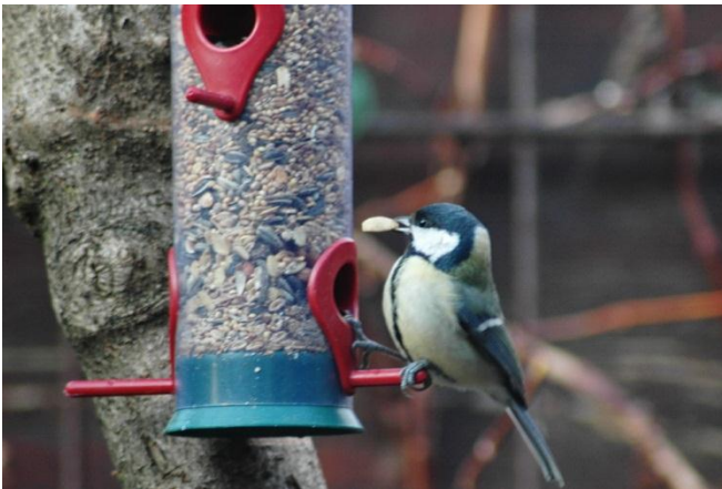
Presse GVID 4-1: Futtersilos sind gut für Körnerfresser geeignet

Es geht um das Füttern von Vögeln im Winter. Auch wenn dies vom Natur- und auch Vogelschutzbund nicht direkt als „Vogelschutz“ angesehen wird, so wird es dennoch von den Naturschutzorganisationen hoch geschätzt. Denn gerade das Füttern bietet eine wunderbare Möglichkeit für alle, die Natur direkt zu erleben, weil besonders an den Futterstellen sich die Tiere im Winter aus nächster Nähe beobachten lassen und man diverse Vogelarten kennen lernen kann. Nur „richtig“ muss die Vogelfütterung sein!