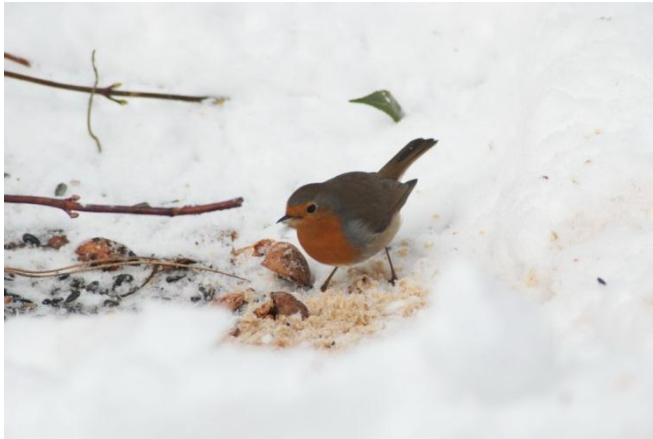
Presse GVID 4-2: Weichfutterfressern kann man Haferflocken geben

werden so aufgehängt, dass das Futter auch bei starkem Wind, Schnee und Regen nicht durchnässt werden kann, da es sonst schnell schimmelt. Zudem muss solch ein Futter-